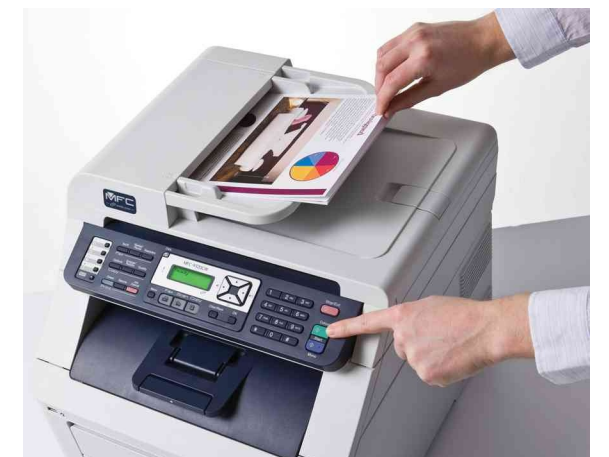
ADF: ideale quando si inviano fax e si fanno copie o scansioni di documenti composti da più pagine.