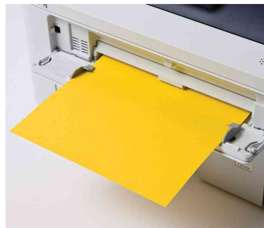
Stampa su carta spessa o buste.

MFC-9320CW grazie alle funzioni di cui è dotato è la soluzione ideale per tagliare i costi, organizzare efficientemente il lavoro e risparmiare tempo in ufficio.